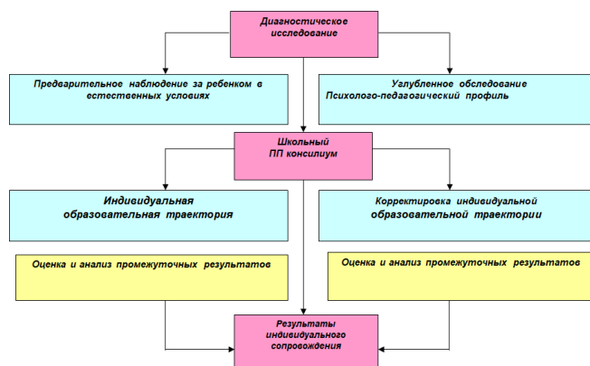
Рисунок 2. Схема взаимодействия педагогов и специалистов

Программа взаимодействия педагогов и специалистов реализуется через работу школьного психолого-педагогического консилиума (ППК). Программа предполагает осуществление комплексного многоаспектного анализа эмоционально-волевой, личностной, коммуникативной, двигательной и познавательной сфер учащихся с РАС с целью определения имеющихся проблем, разработки и реализации образовательной траектории, представленной на рисунке 2